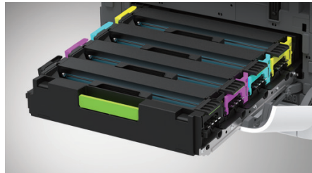
토너 / 드럼 일체형 카트리지

250매 급지대를 2개까지 연결할 수 있어 업무 맞춤형 용지 급지가 가능합니다.