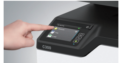
2.8인치 컬러 터치 스크린

CMYK 색상별 토너/드럼 일체형 카트리지로 소모품 교체의 번거로움을 최소화하였고, 비용도 분리형 제품에 비해 경제적입니다.